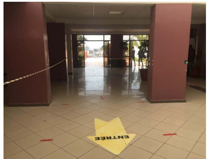
Le 1 er Hall: un grand espace situé à l'entrée pouvant servir de salle d'accueil des Ridéfiens à leurs arrivées