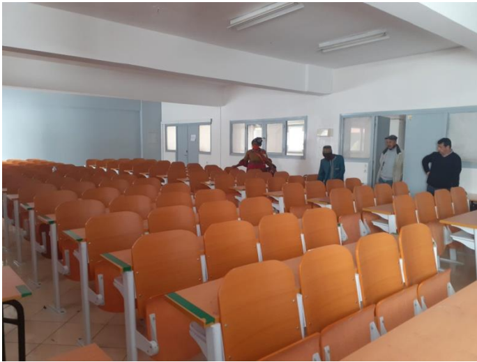
Amphi 3,4 : possédant une capacité de 100 personnes chacun pour des conférences