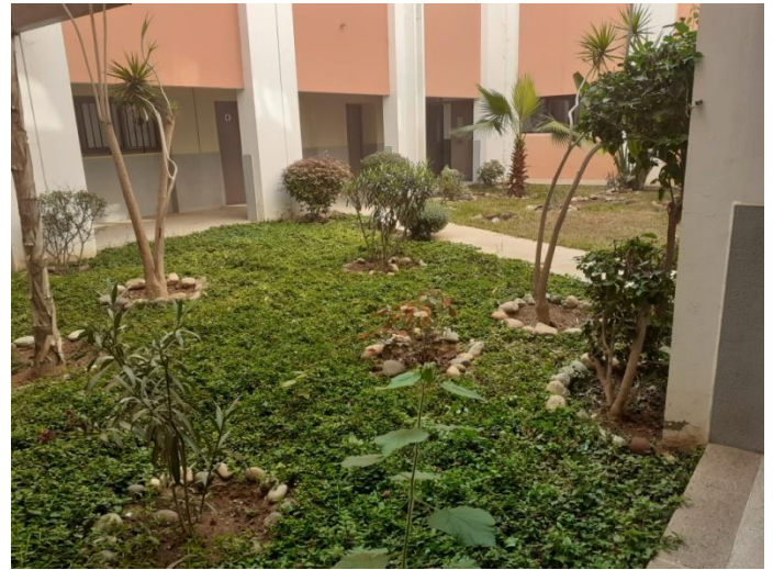
un espace vert qui pourrait également être utilisé pour un atelier