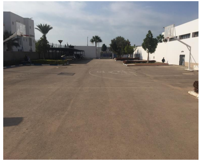
Autres espaces ouverts et terrain de basket et parking