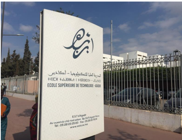
À l'entrée principale du bâtiment de l'Ecole Supérieure de Technologie (EST)