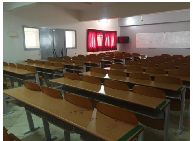
Les salles des langues et cours et la bibliothèque : pouvant accueillir les conférences, les ateliers longs et cours